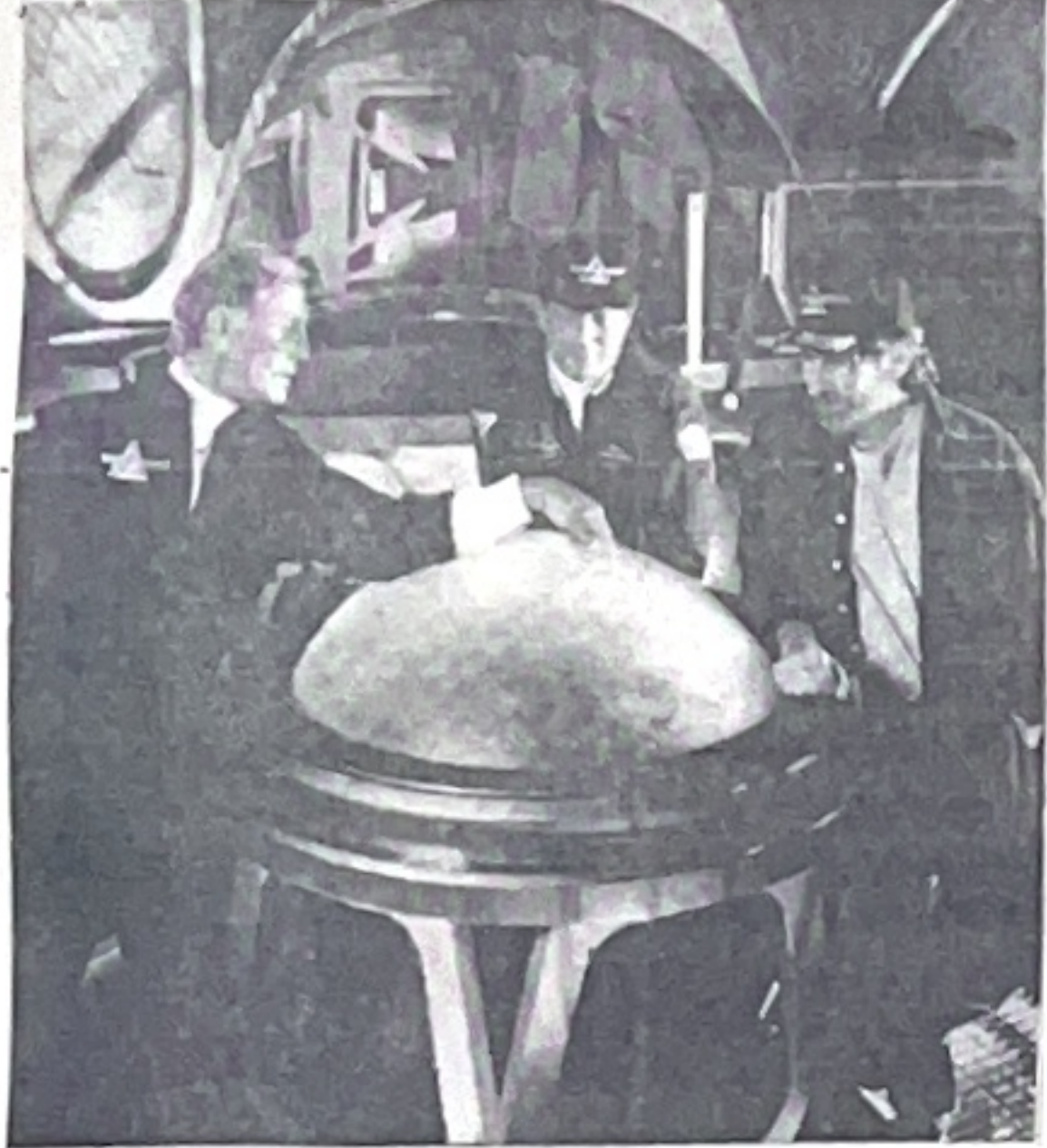
Ảnh: Các chuyên gia của cơ quan không gian Hoa Kỳ (NASA) đang lên kế hoạch "phục kích" ... đĩa bay