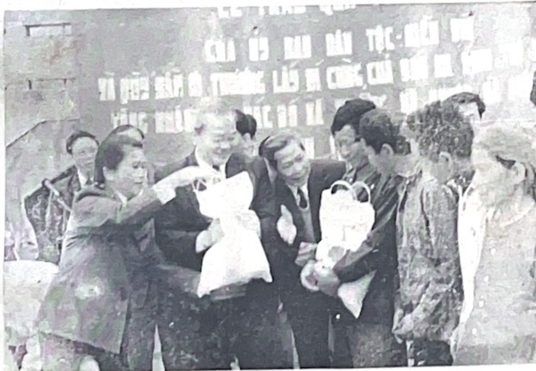
Tặng quà nhân dân Pac Bó

LTS- Kỷ niệm 55 năm ngày Bác Hồ về Pac Bó (28-1-1941/28-1-1996), Ủy ban Dân tộc - Miền núi và Bảo An ninh Thủ đô phối hợp tổ chức đợt quyền góp quà tình nghĩa tặng bà con quê hương cách mạng. Ý tưởng đó được đông đảo các đơn vị, cá nhân, tổ chức xã hội nhiệt liệt ủng hộ. Ngày lên đường về cội nguồn đã đến.