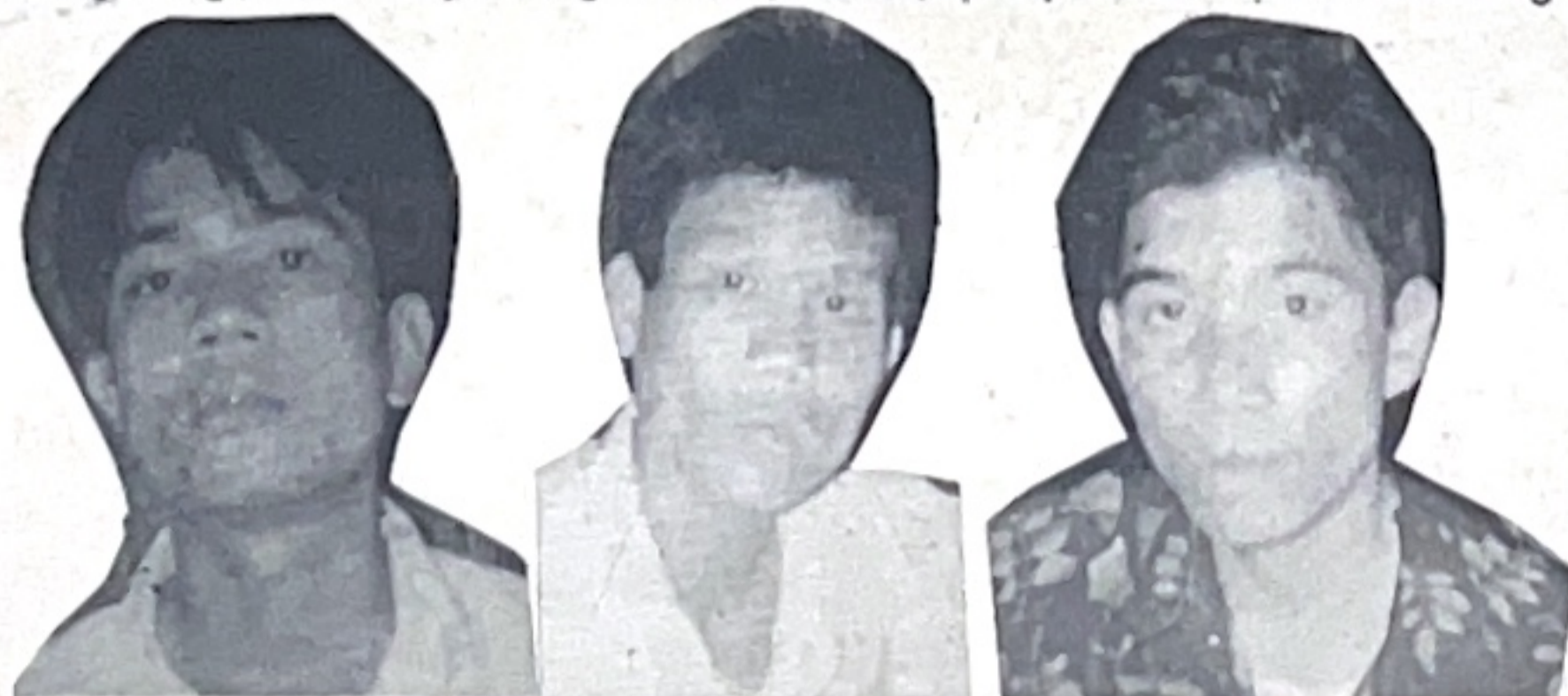
Những đối tượng sẽ bị xử lý nghiêm trước pháp luật

tượng diện còn đó hung hãn và số thanh thiếu niên có biểu hiện hoạt động phạm pháp. Đưa ra tổ dân phố đấu tranh 24 đối tượng... Nhiều biện pháp nghiệp vụ khác đang tiếp tục được triển khai thực hiện một cách cụ thể, tích cực, triệt để nhằm trấn áp, đấu tranh có hiệu quả các hoạt động của tội phạm. Song hiện nay, tình hình hoạt động của đối tượng lưu manh còn đó hung hãn sử dụng vũ khí thô sơ vẫn diễn biến phức tạp, đáng lo ngại. Mới đây, trong khi cơ quan luật pháp chuẩn bị đưa tên hung