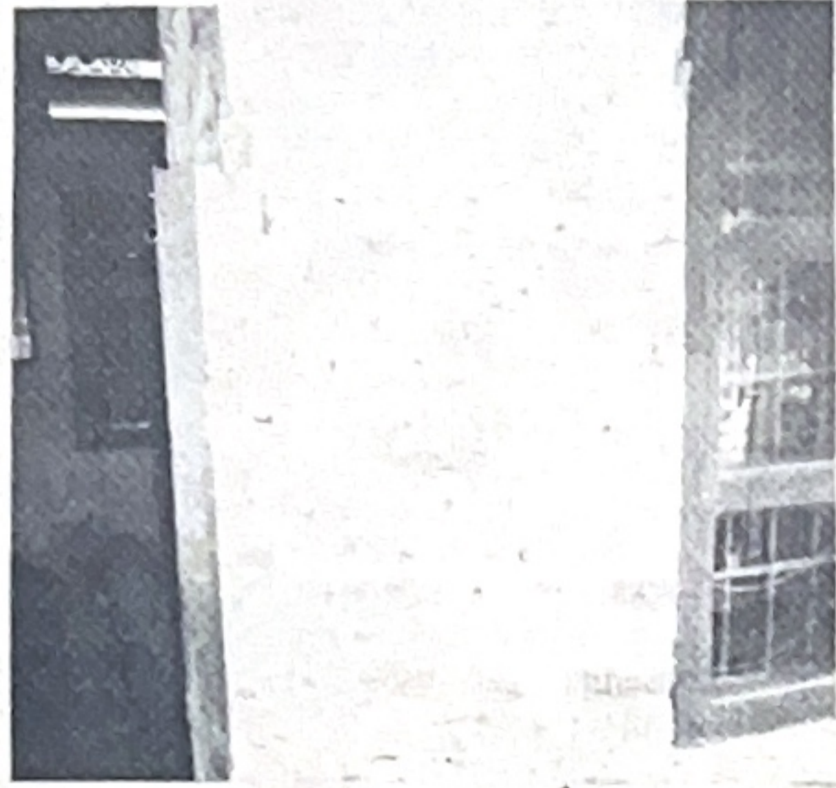
Những vết nứt đang đe dọa ngôi nhà

nhiều" đến với gia đình cụ May. Đối với ông cháu cụ bây giờ nếu như đủ no, đủ ấm là mãn nguyện lắm rồi và chẳng có điều gì phải suy nghĩ, trăn trở. Nhưng hiện nay, một tai họa đang đe dọa tính mạng của năm ông cháu cụ và cụ đã phải viết đơn gửi đi khắp nơi để cầu cứu. Theo địa chỉ trong đơn, chúng tôi tìm đến phường Thịnh Quang, quận Đống Đa. Loanh quanh qua những con đường nhỏ trong khu tập thể, đồng chí Hòa Phó chủ tịch UBND phường đã đưa tôi đến nhà cụ May ở số 9 B3, khu phố Vĩnh Hồ. Điều đầu tiên đập vào mắt tôi là bức tường chính của căn nhà 40 mét vuông của cụ đã bị nứt từ chân móng lên tới trần, vết nứt khá lớn làm bức tường gần như đứt ra, tạo thành lỗ hổng đứt lư ngón tay. Những bức tường bên cạnh cũng rạn nứt từ móng lên, còn trần nhà thì