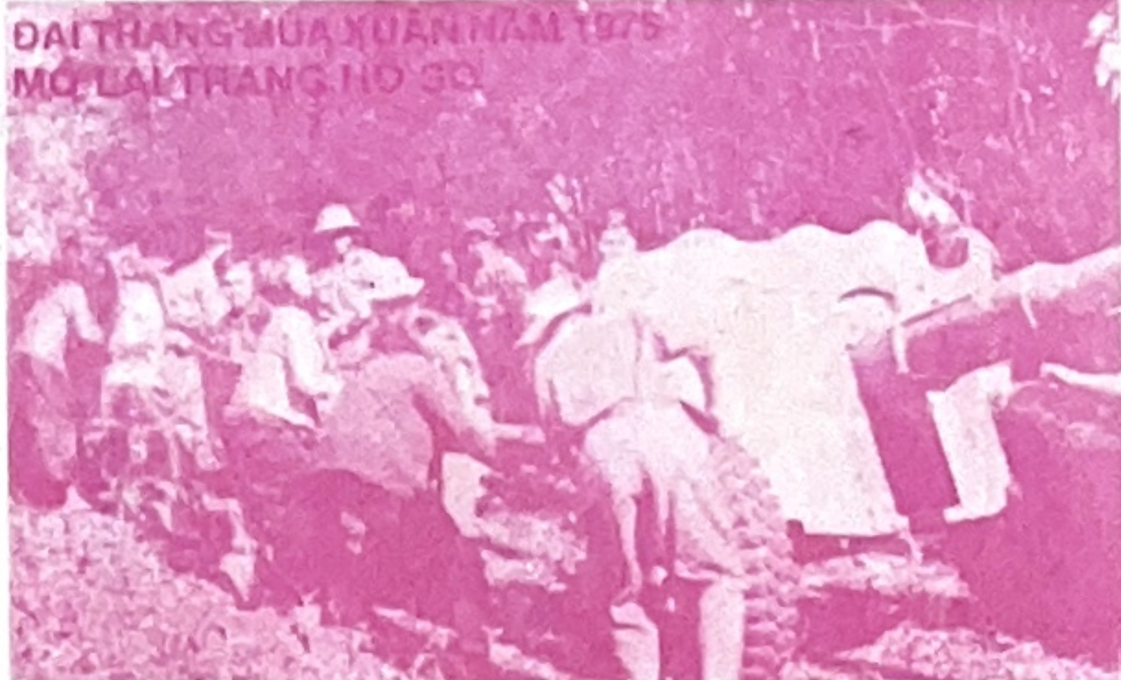
Đồng bào Tây Nguyên cùng bộ đội kéo pháo vào vị trí chiến đấu