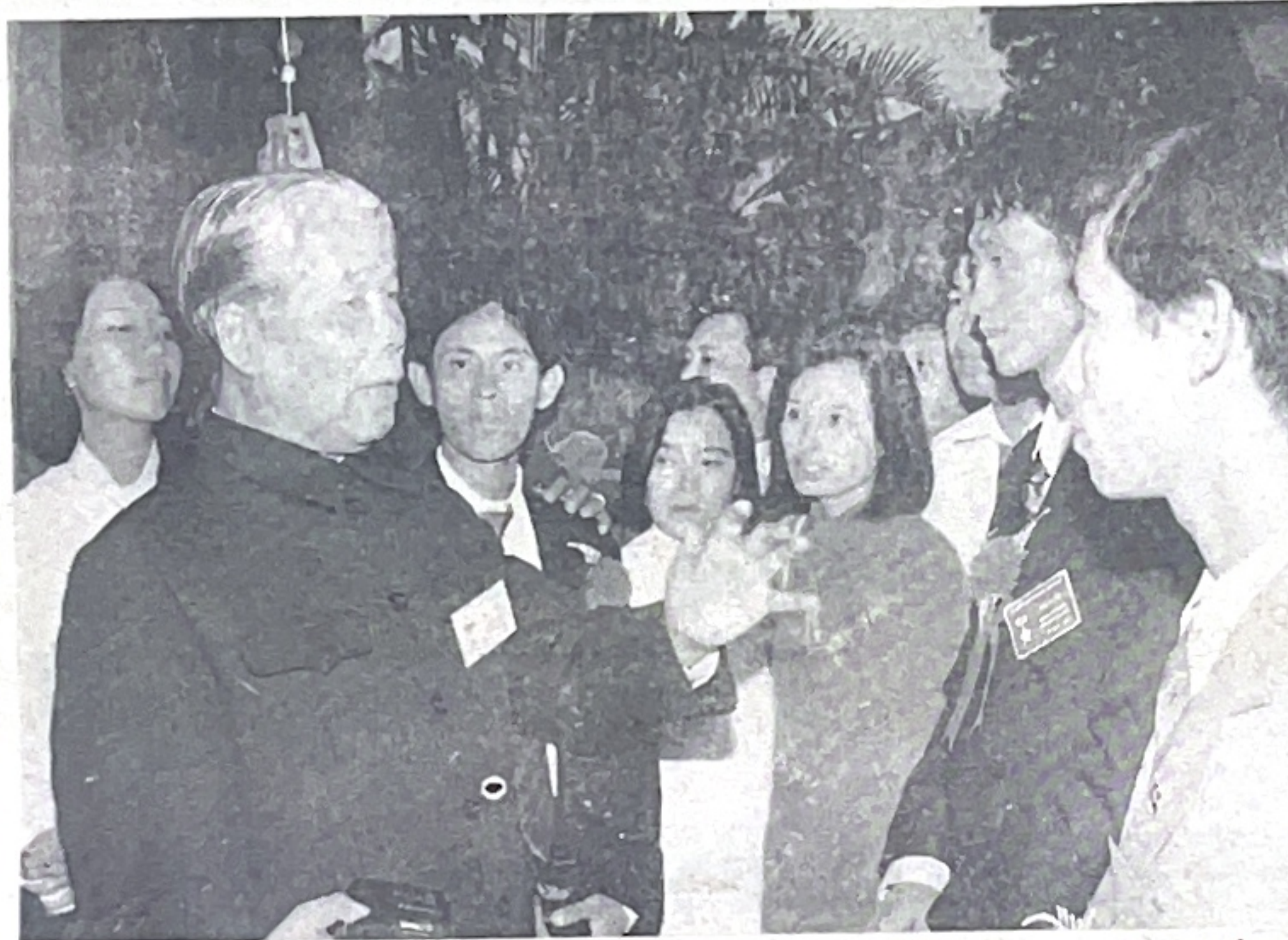
Tổng Bí thư Đỗ Mười với các đại biểu Đoàn viên thanh niên tiên tiến xuất sắc