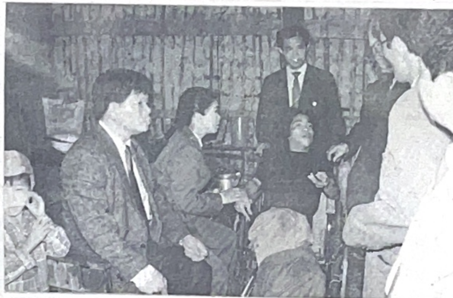
Ảnh trên: Tặng quà trường PTCS Pác Bó