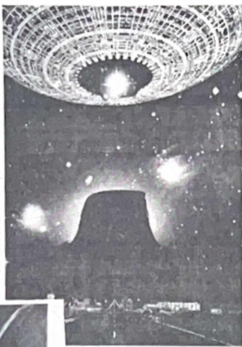
Ảnh: Những vật thể bay không xác định xuất hiện ở Rosewell (Mỹ)