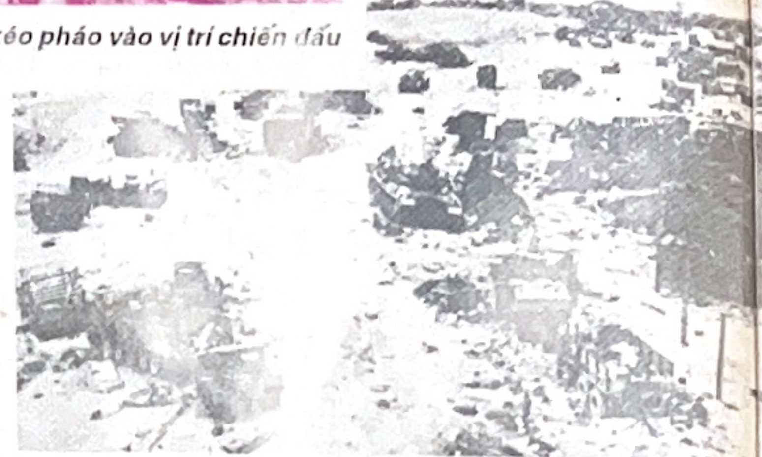
Thảm bại, rút chạy

Thư nêu mấy ý: Phản đối tin chuyển bộ tổng tham mưu ra hạm tàu để chỉ huy và tiện rút đi khi cần thiết nếu tin trên là sự thật. Không tán thành thông báo của DAO (cơ quan tùy viên quân sự Mỹ - thực chất là bộ chỉ huy) cho tổng cục lập danh sách người cần đi tản dã làm hoang mang, hoảng sợ cho sĩ quan ở tổng cục và cuối cùng nói lên ý ông ta sẽ ở lại với liều độc được bên mình khi thấy cần thiết sẽ chết ở ngay trên mảnh đất quê