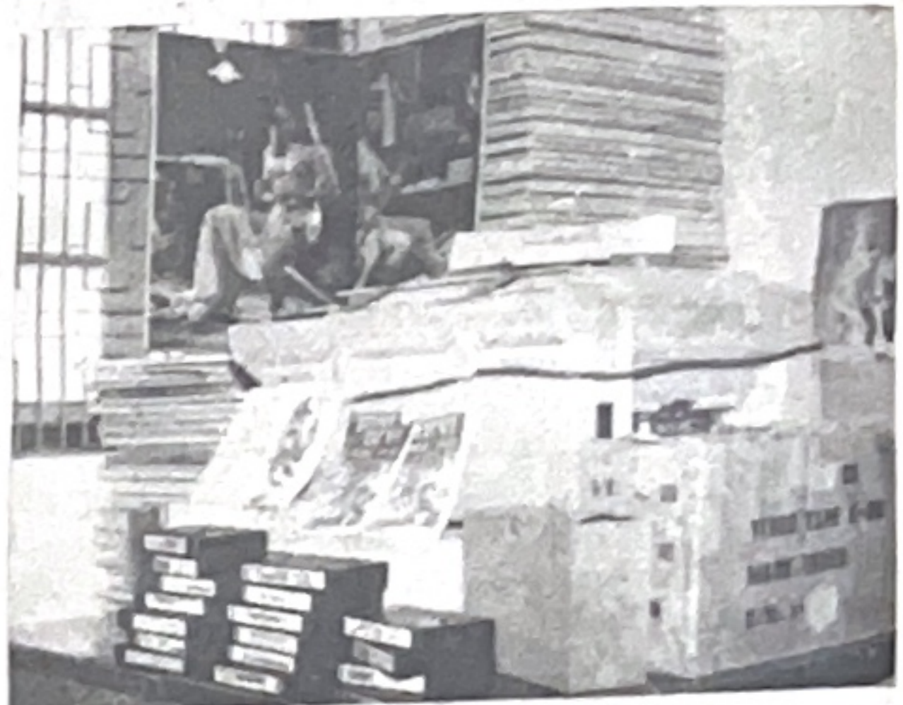
Một số loại văn hóa phẩm có nội dung đồi trụy, mê tín dị đoan bị ngành văn hóa thông tin và công an quận Hai Bà Trưng thu hồi.

Ngày 9-11-1992, Công ty trách nhiệm hữu hạn MANSFRIED TOSERCO đã chuyển tiền nộp theo ủy nhiệm chỉ số 3/11 ngày 9-11-1992 theo đúng số tiền 65.875.500 đồng mà phòng thuế trước bạ và thu khác thuộc Cục thuế thành phố Hà Nội thông báo.