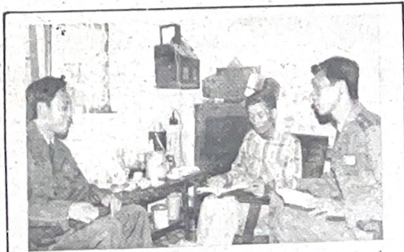
Gắn bó với dân và nắm chắc tình hình là việc trọng tâm của cảnh sát khu vực, công an huyện Từ Liêm.