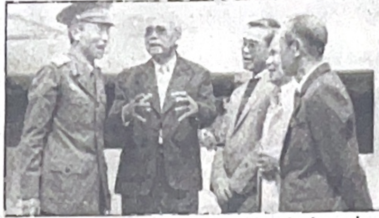
Trung tướng Chu Duy Kính, Tư lệnh trưởng Quân khu Thủ đô và các nhà cách mạng lão thành trước là chiến sĩ tự vệ những năm đầu của cuộc kháng chiến chống thực dân Pháp xâm lược (năm 1946)

Có những hội CCB cơ sở cấp phường, xã đã phát huy được truyền thống "Bộ đội Cụ Hồ", dũng cảm đương đầu đấu tranh với cái sai, cái xấu, giành lại