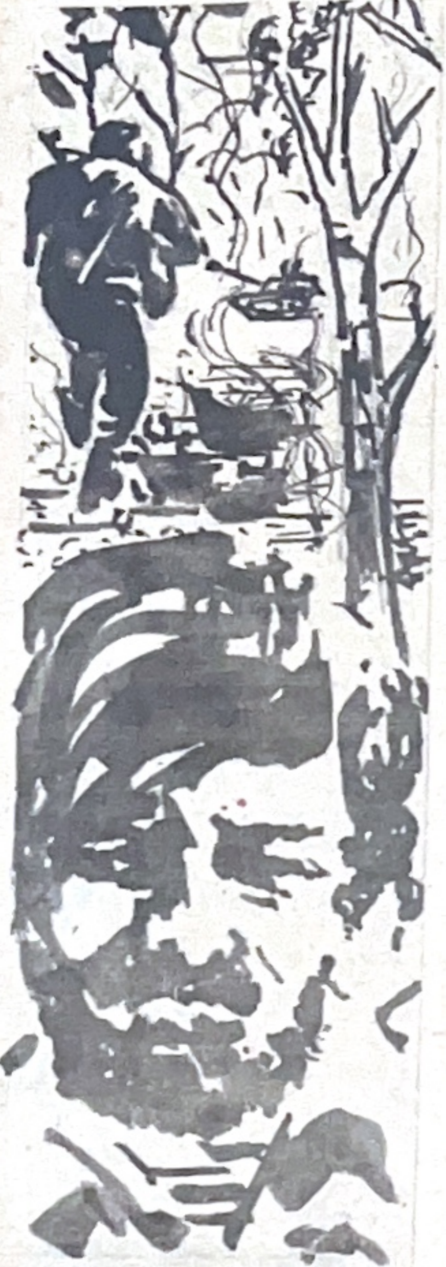
Minh họa: PHƯƠNG ANH

Desmond Philton bàng hoàng một chút. Anh quên cả thắt dây lưng. Anh