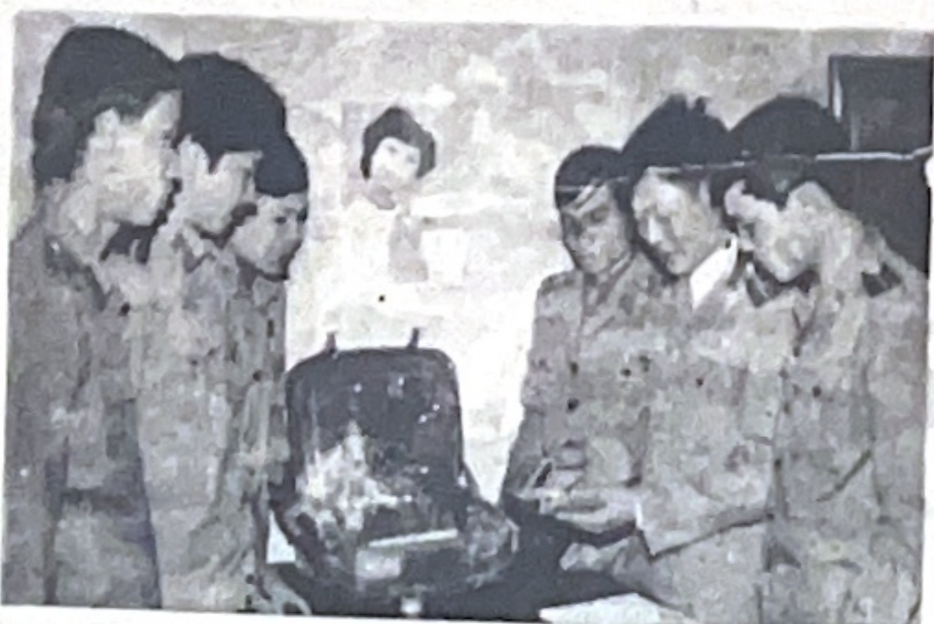
Cán bộ, chiến sĩ đội điều tra thuộc công an huyện Mê Linh rút kinh nghiệm sau khi phá án

Một tâm biến nhỏ được treo ra cửa. Thế là, bố mẹ học sinh tìm đến. Có phụ