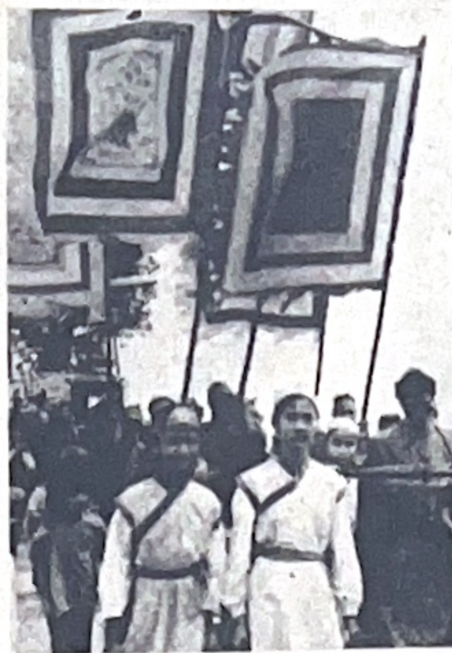
Hội Lim