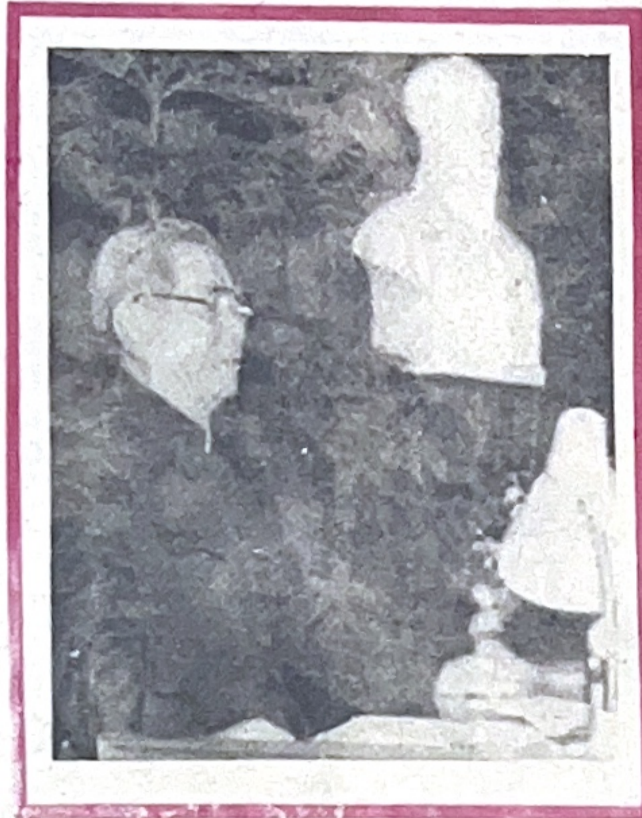
Thưa các đồng chí,

Hôm nay nhân dịp đầu xuân mới Tân Mùi, tôi rất vui mừng được gặp mặt các đồng chí cán bộ lãnh đạo các cơ quan của Bộ Nội vụ, công an các thành phố và các đại biểu chính quyền, đoàn thể, các quận, huyện, phường, xã trong toàn quốc có thành tích xuất sắc nhất trong phong trào thi đua bảo vệ an ninh Tổ quốc năm 1990 về dự hội nghị tổng kết của Bộ tại thủ đô Hà Nội.