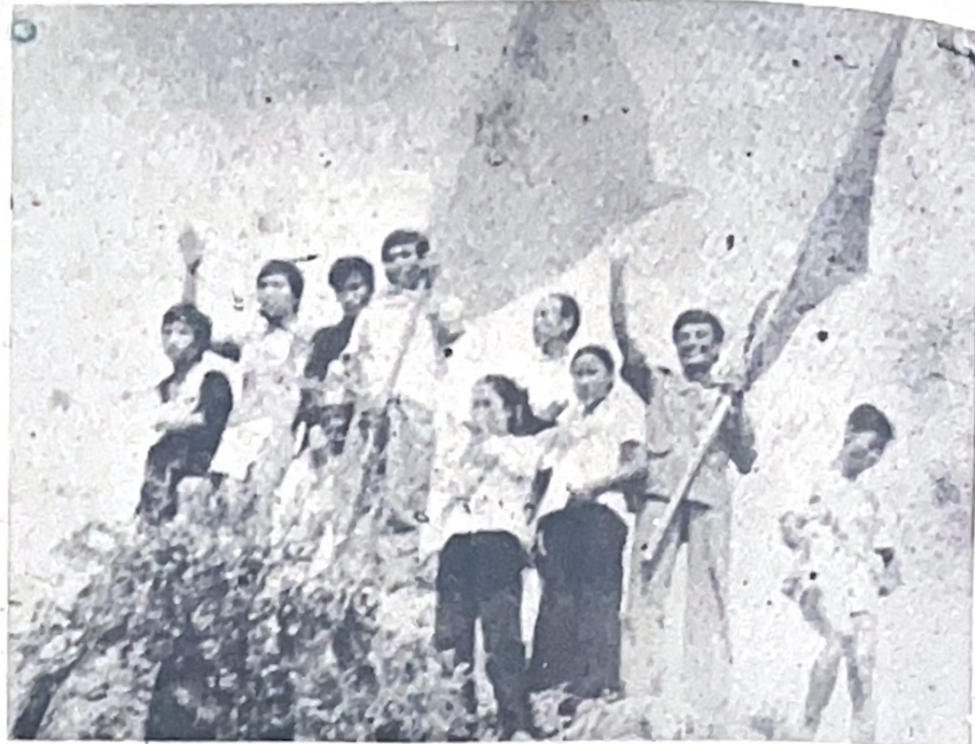
núi nơi các vận động viên thi là núi Hòa Bình và cánh rừng quanh núi là rừng Tuổi Xanh.