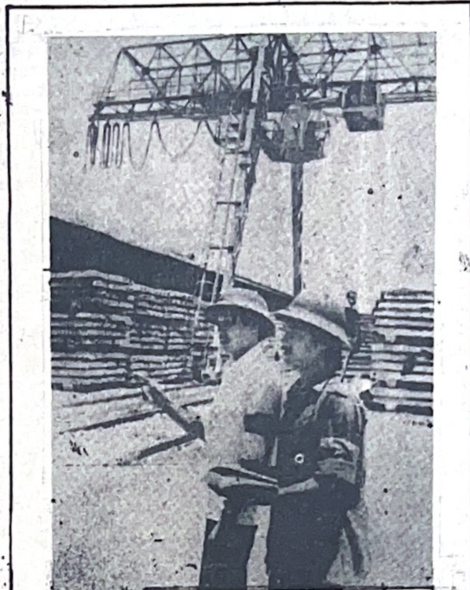
Do liên kết tốt với 2 xã Kim Chung, Kim Nỗ (Đông Anh), Nhà máy bê-tông Thăng Long đã làm tốt việc bảo vệ tài sản Nhà nước Ảnh: ĐỨC HOÀN

Sau khi tên lính Pháp cuối cùng rút lên cầu đi về phía Gia Lâm, xuống Hải Phòng lên tàu biển ra đi vĩnh viễn thì chúng tôi cho ô-tô đến đón các đồng