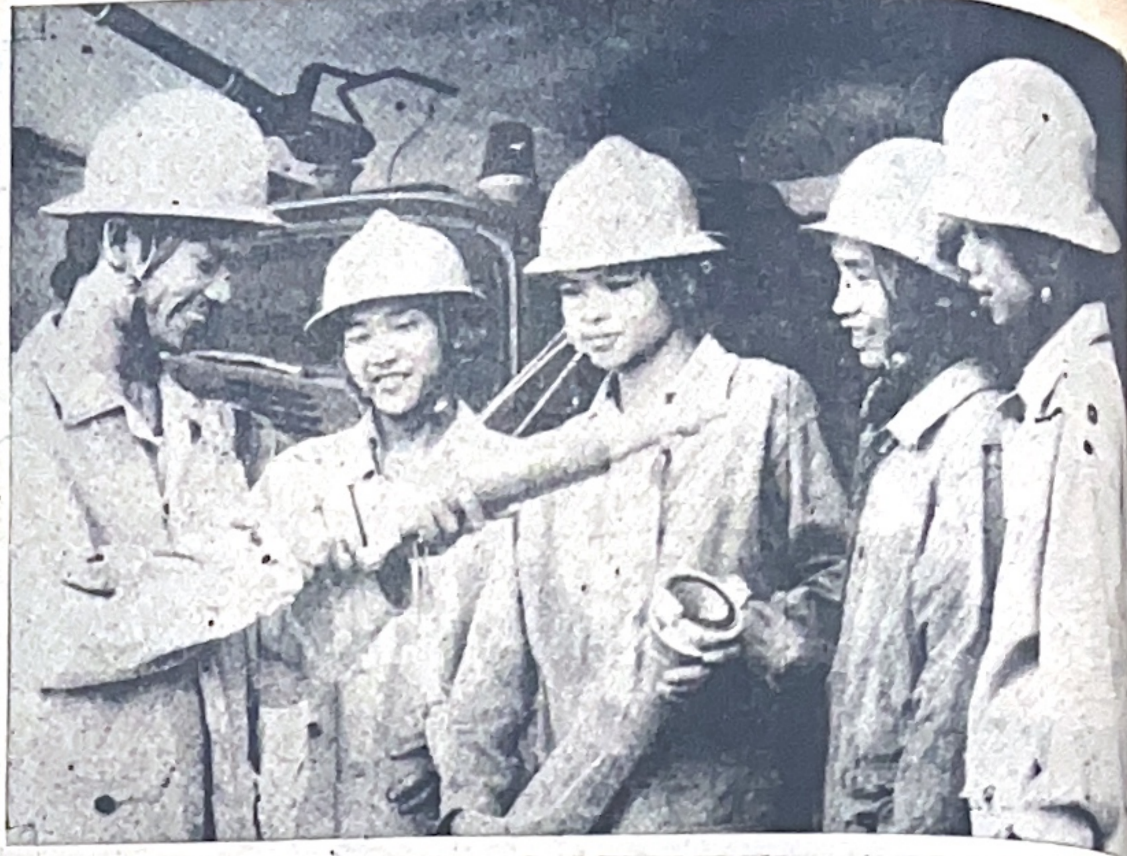
Trao đổi kinh nghiệm nghiệp vụ ở đơn vị cảnh sát PCCC Lộc Hà - Đơn vị Anh hùng