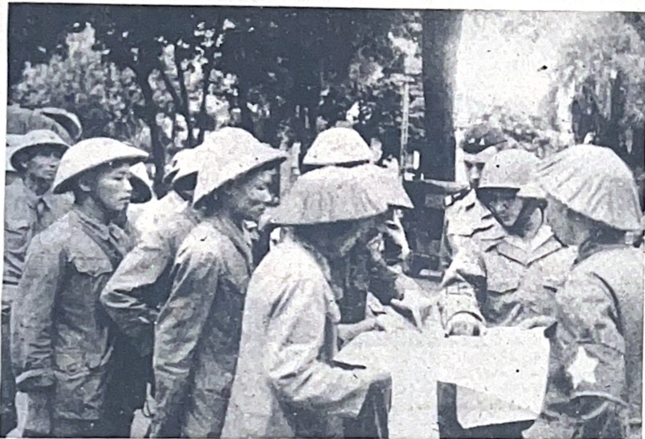
Các tên sĩ quan Pháp nhận kế hoạch rút quân của chúng khỏi thủ đô ngày 10-10-1954